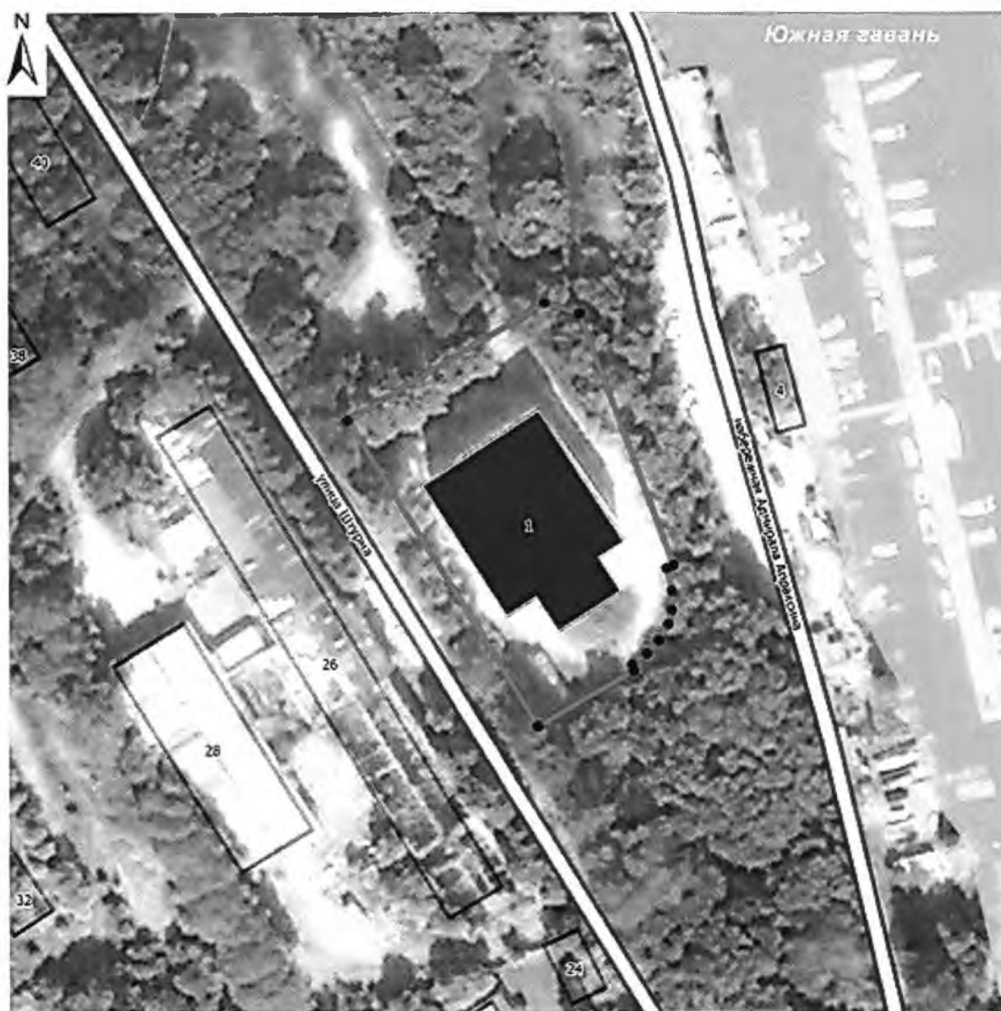
Карта (схема) границ территории объекта культурного наследия

Границы территории объекта культурного наследия регионального значения «Здание архива» по адресу: Ленинградская область, г. Выборг, ул. Штурма, д. 1