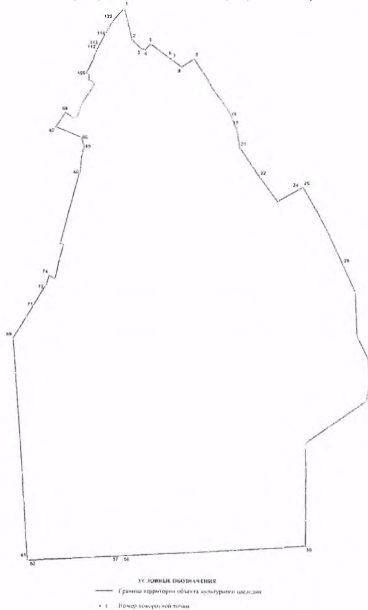
Схема характерных точек границ территории объекта культурного наследия федерального значения «Приоратский парк»