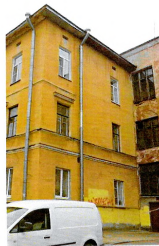
Дворовый С-В фасад

5.5.5. Дворовый С-В фасад: трехэтажный, гладко оштукатурен, симметричной композиции. Фасад разделен по вертикали на 3 части межэтажным фризом и тягой исторического подкарнизного фриза, прорезан прямоугольными оконными проемами ( часть исторических проемов заложена ).