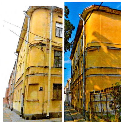
Западный и южный углы

5.5.3. Фасады западного и южного углов: трехэтажные, гладко оштукатурены, расчленены по вертикали на 3 части межэтажным фризом и тягой исторического подкарнизного фриза. Проемы первых двух этажей западного угла и проем 2-го этажа южного угла заложены.