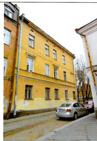
Уличный С-З фасад

5.5.2. Уличный С-З фасад: трехэтажный, гладко оштукатурен, симметричной двухчастной композиции. Фасад разделен по вертикали на 3 части межэтажным фризом и тягой исторического подкарнизного фриза, прорезан 5 прямоугольными оконными проемами в уровне первых двух этажей ( проем 2-го этажа по 5-ой оси заложен ) и четырьмя проемами в уровне 3-го этажа.