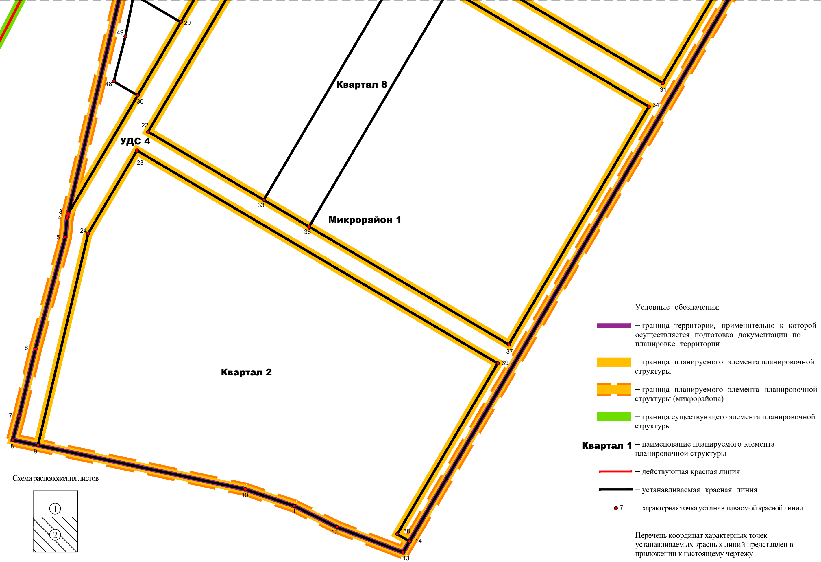
Схема расположения листов