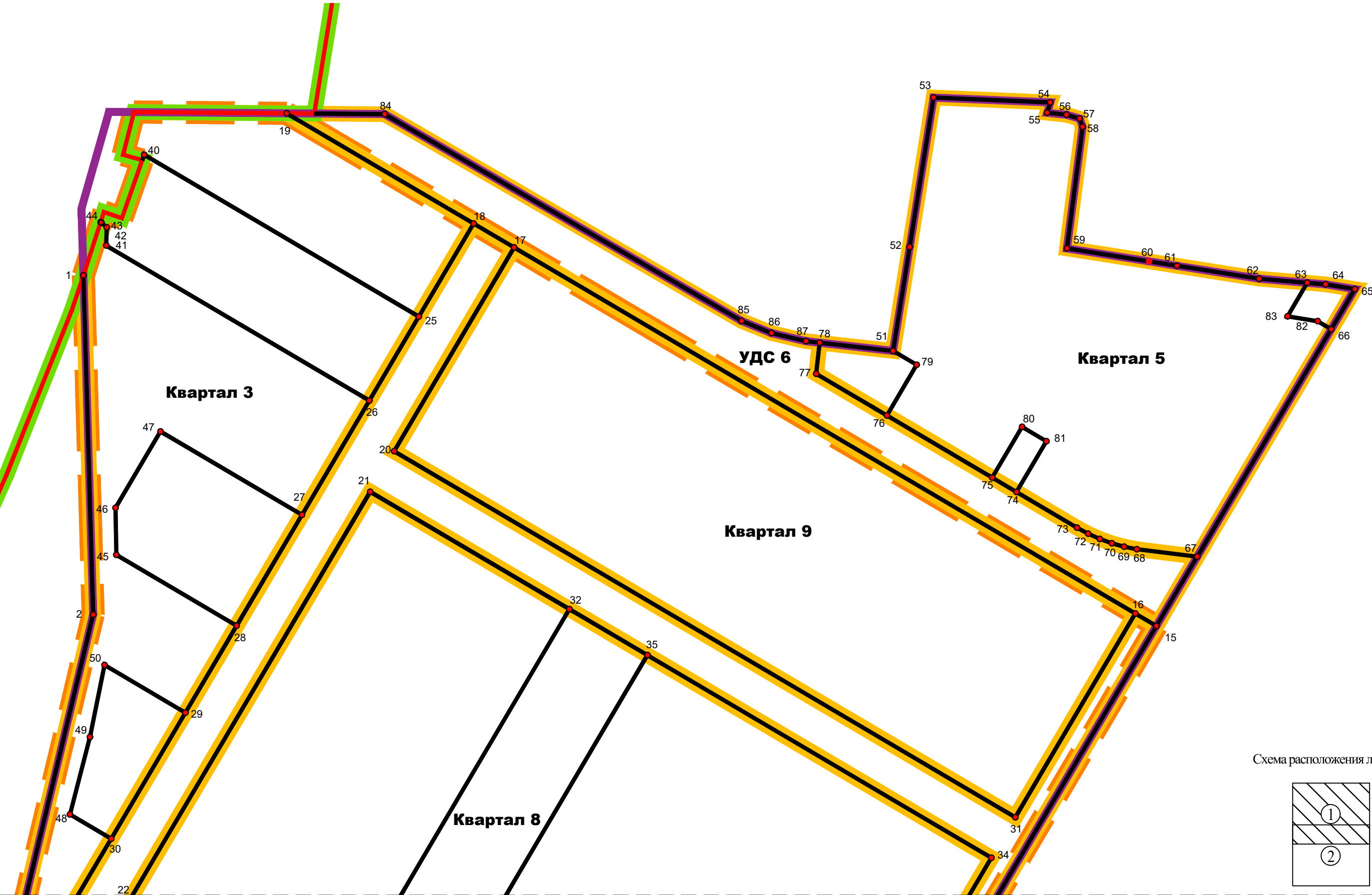
Схема расположения листов

Условные обозначения представлены на листе 2 настоящего чертежа