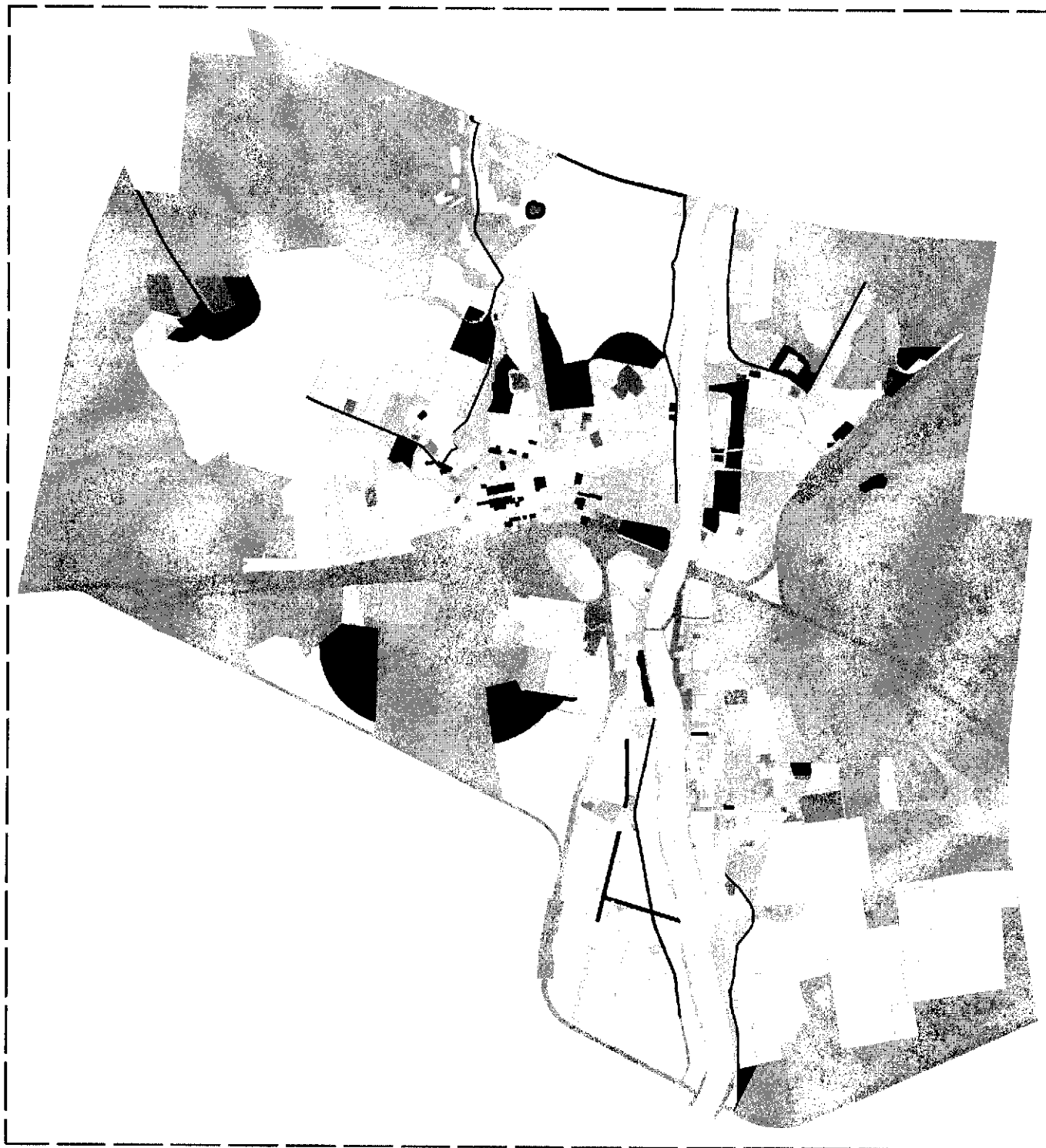
Схема расположения территорий, для которых изменяется функциональное зонирование