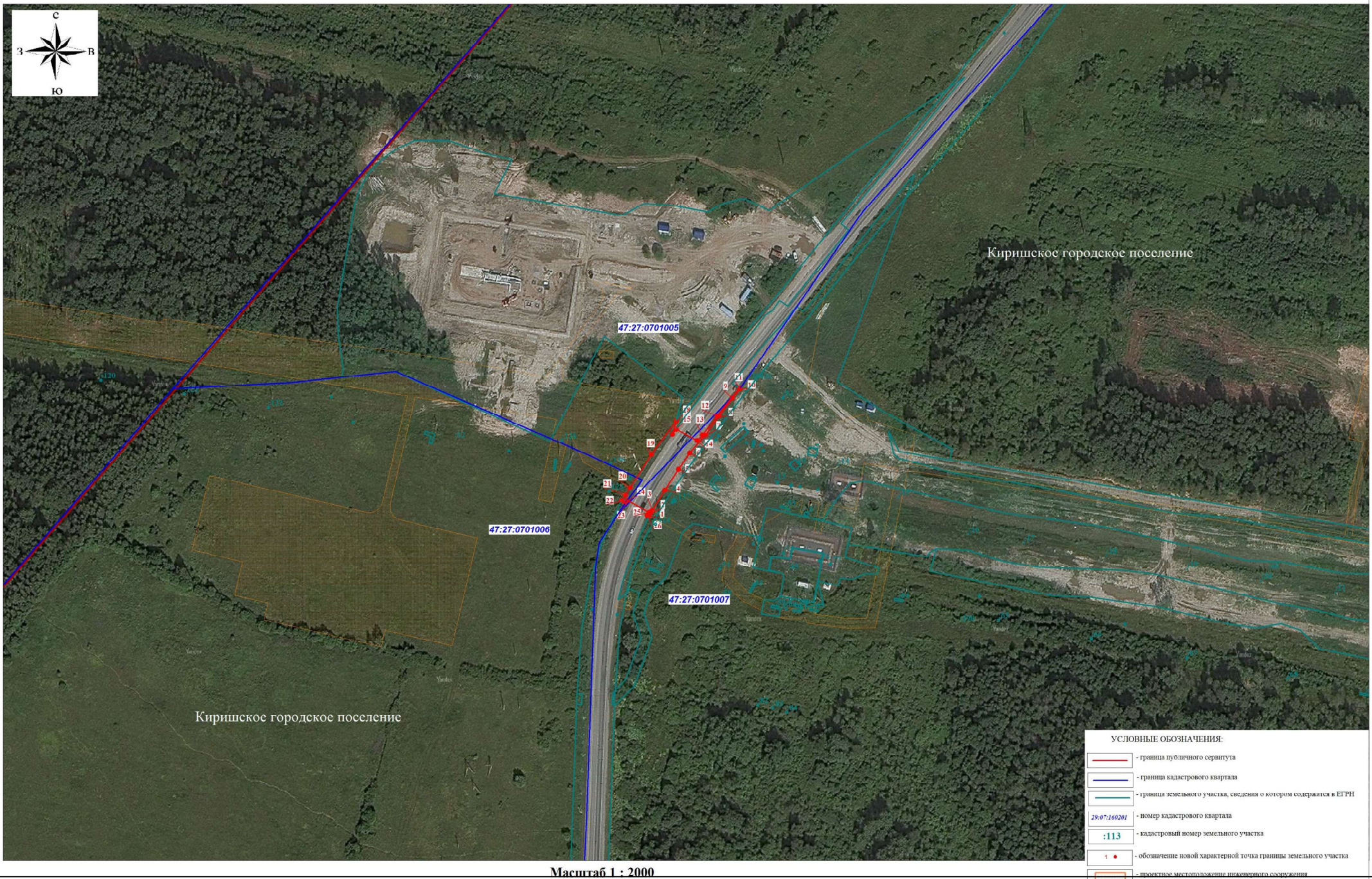
Масштаб 1 : 2000