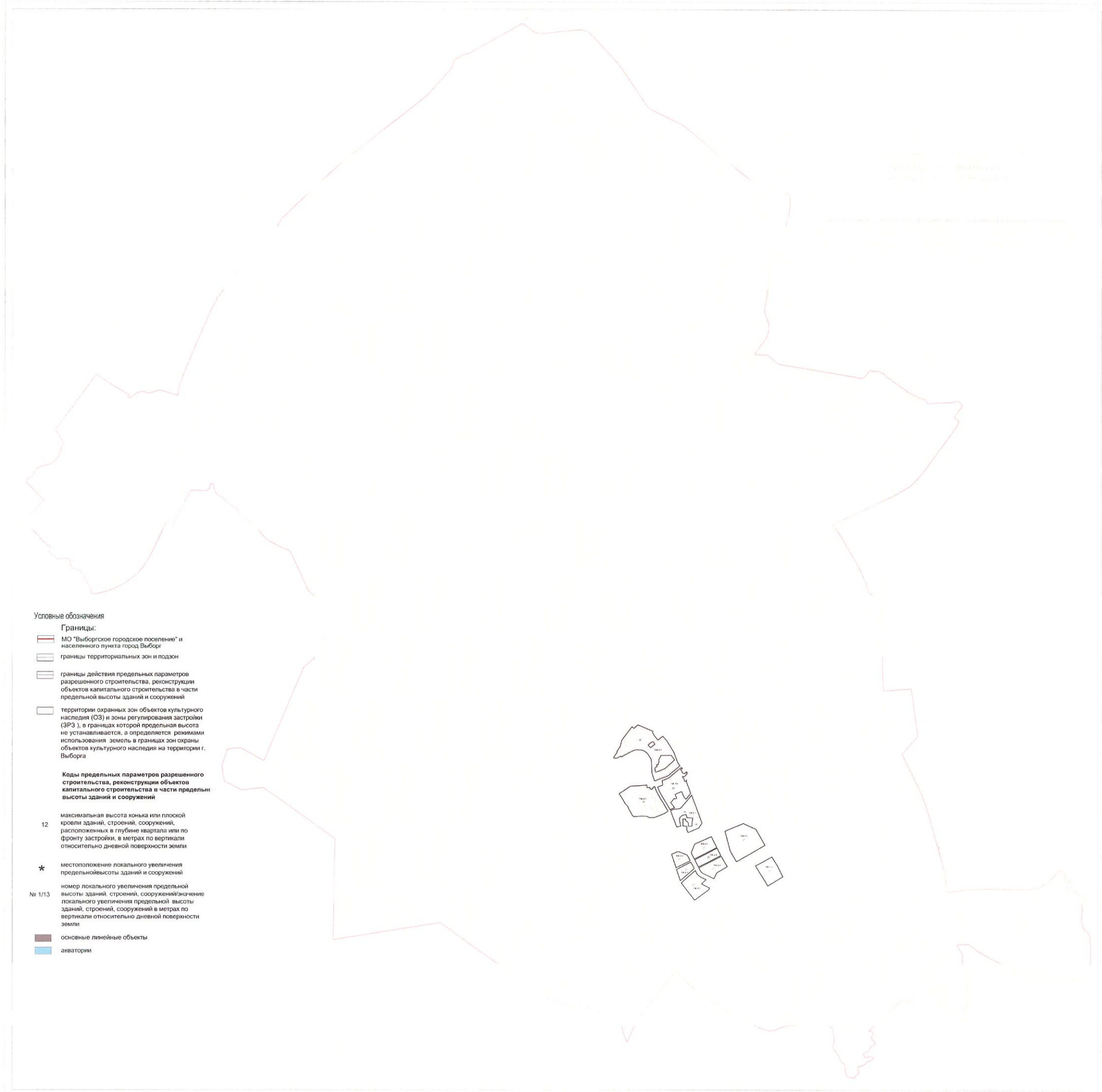
Схема границ действия предельных параметров разрешенного строительства, реконструкции объектов капитального строительства в части предельной высоты зданий, строений и сооружений