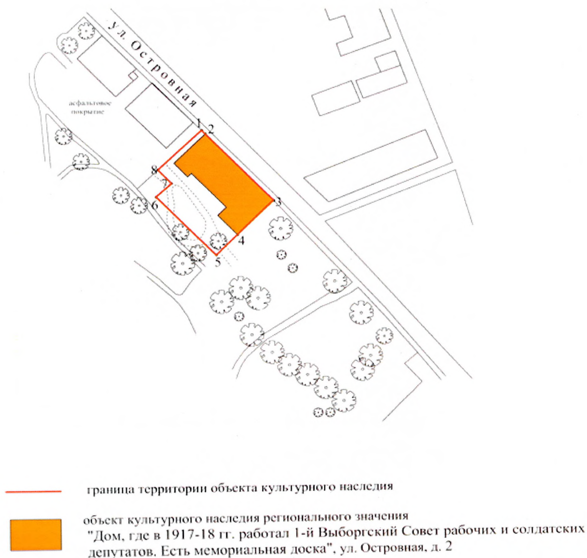
Карта (схема) границ территории объекта культурного наследия

Границы территории объекта культурного наследия регионального значения «Дом, где в 1917-18 гг. работал 1-й Выборгский Совет рабочих и солдатских депутатов. Есть мемориальная доска», расположенного по адресу: Ленинградская область, Выборгский муниципальный район, г. Выборг, ул. Островная, д. 2