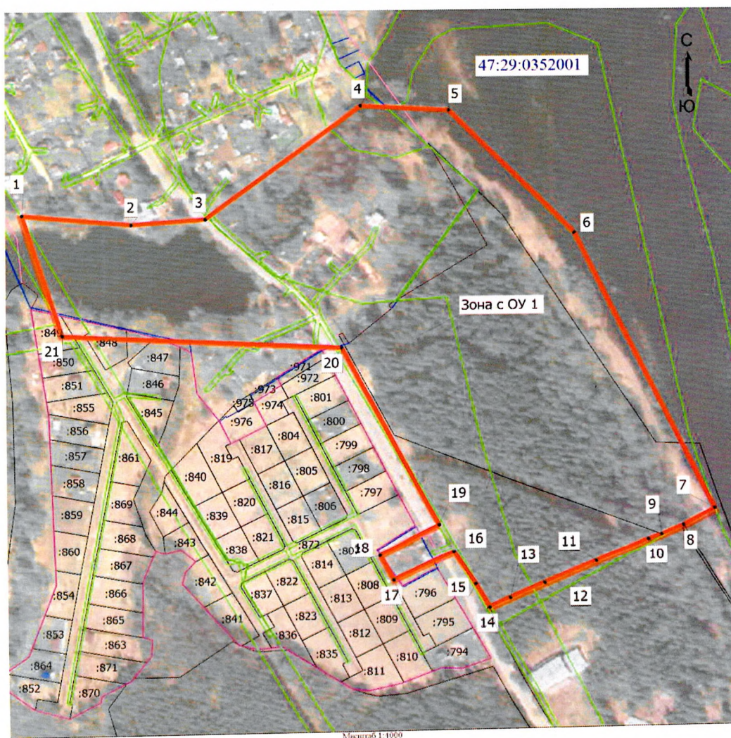
Карта (схема) границ территории объекта культурного наследия

Границы территории объекта культурного наследия регионального значения «Усадьба А.Я. Прозорова «Тосики», расположенного по адресу: Ленинградская область, Лужский муниципальный район, Толмачёвское городское поселение, г.п. Толмачево, участок 2 «О»