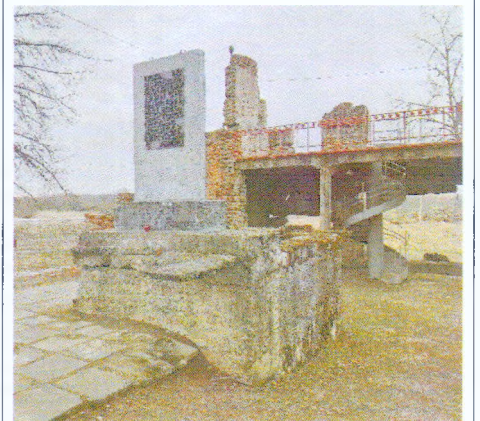
Центральная часть памятника с северо-востока