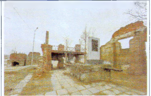
Общий вид на памятник с юго-востока

(местоположение, габариты, шрифт и техника исполнения надписи -объемные накладные металлические цифры)