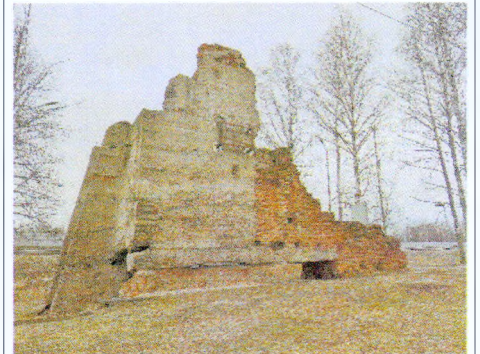
Общий вид на центральную часть памятника с юго-запада