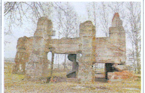
Общий вид на центральную часть памятника с юго-запада