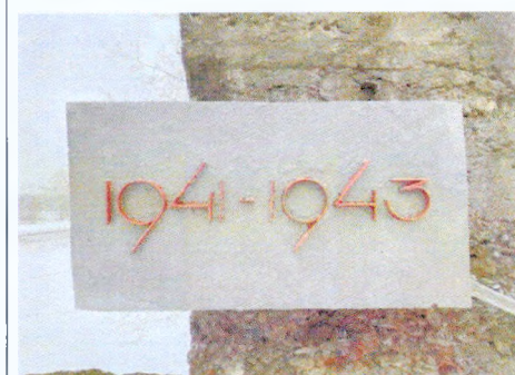
Памятная металлическая доска северо-западной стелы

Предмет охраны может быть уточнен при проведении дополнительных научных исследований.