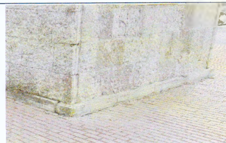
Облицовка постамента известняком

«В БОЯХ ЗА КИРИШИ ПРИНИМАЛИ УЧАСТИЕ / ВОИНЫ СОЕДИНЕНИЙ И ЧАСТЕЙ / 4 -Й и 54-Й Армии Волховского ФРОНТА»