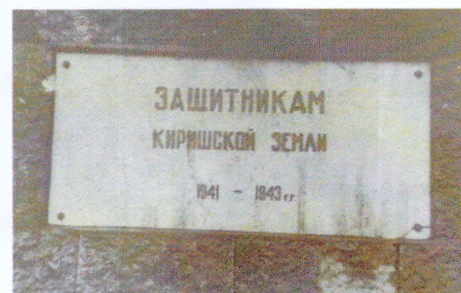
Памятная доска на лицевой стороне постамента (фотография 1991 г.)