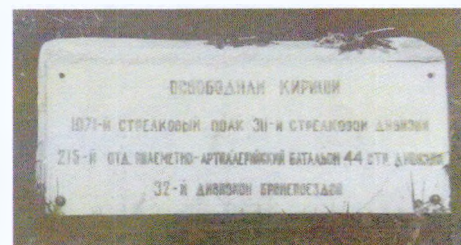
Памятная доска на тумбе слева от постамента (фотография 1991 г.)